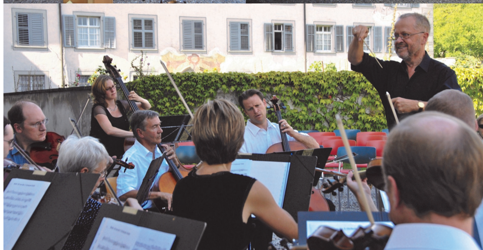
Impressionen von der Jubiläumsfeier im Kloster Fahr am 3. September 2011